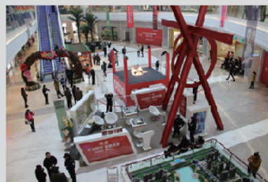
从冠名亚洲最大的开元湖音乐喷

在整个营销活动过程中，泉舜策划部与销售部通力配合，默契合作，分别在洛阳市九县六区通过跑渠道、派单页、电话call客等方式，在活动开启一周时间内，为售楼部带来近千组来电、1200多组来访，成交44套，完成了3300万良好业绩，全洛阳市民“谈千万现金而知泉舜”！在售楼部为一套房源争的面红耳赤的客户表示：泉舜房子品质自然是没话说，位置、配套也都是无可挑剔，至于价格，我就是眼睁睁的看着泉舜价格一点点的涨上去的一拨人，这些年眼看着购物中心、泉舜186、泉舜豪生酒店这些大配套一点点的成熟起来，就超级后悔当时没有买，所以像今天这样的机会我们也等好久了，你看看这现场的人，如果今天再犹豫一下，恐怕以后真是没有机会了！”